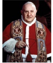
Heilige paus Johannes XXIII (Angelo Roncalli)

Bij gelegenheid van de heiligverklaring van de pausen Johannes XXIII en Johannes Paulus II, op zondag 27 april, heeft het bisdom Roermond ruim 140.000 gebedsprentjes laten drukken. Deze worden voor een groot deel in de komende Paasweek verspreid in de Limburgse parochies en kloosters. Een ander deel is gedrukt ten behoeve van de overige Nederlandse bisdommen.