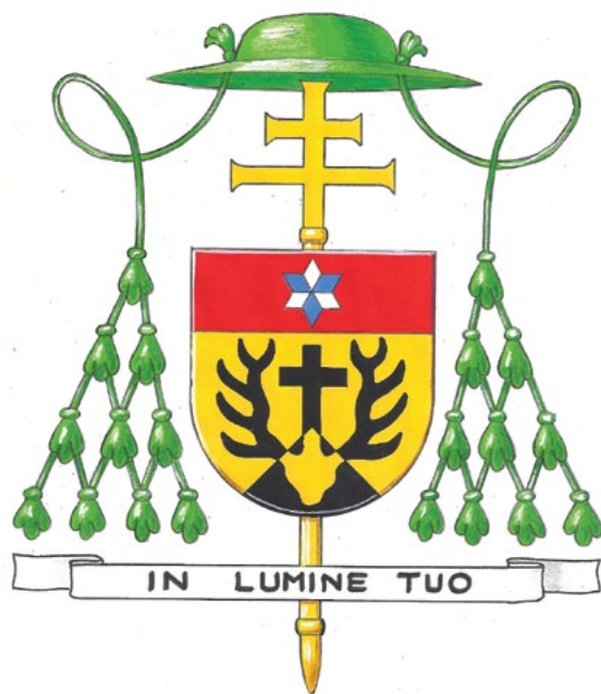
Het aartsbisschoppelijk wapen van mgr. Van Megen

Een nuntius is altijd aartsbisschop. Veelal vindt een bisschopswijding van een nuntius plaats in Rome. Opdat ook zijn familie er bij kan zijn, zal dit in het geval van Van Megen in Roermond zijn. Voor de wijding op 17 mei zal een aantal bisschoppen uit binnen- en buitenland worden uitgenodigd.